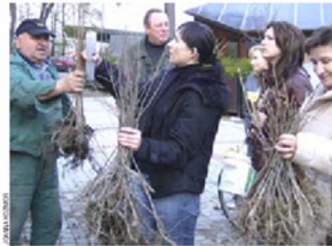
W związku z remontem Rynku akcję tym razem przeprowadzono na parkowym placu przy ulicy Mickiewicza.

– Tylko przyroda trzyma nas przy życiu. Jak zginie, to ludzie zaczną padać jak muchy. Dlatego